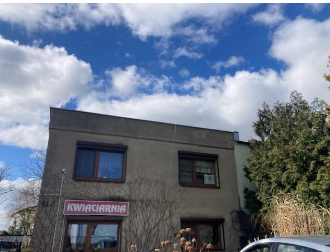
Zabudowa mieszkalno-usługowa przy ul. Gołęcińskiej