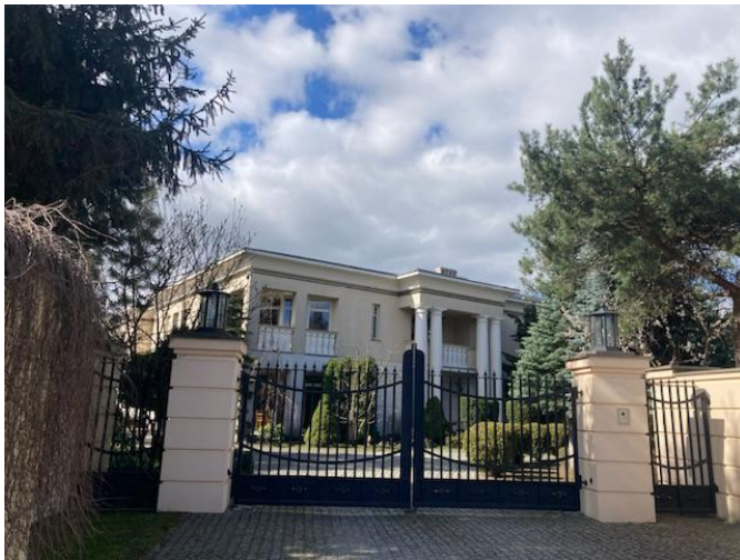
Budynek mieszkalny na obszarze planu