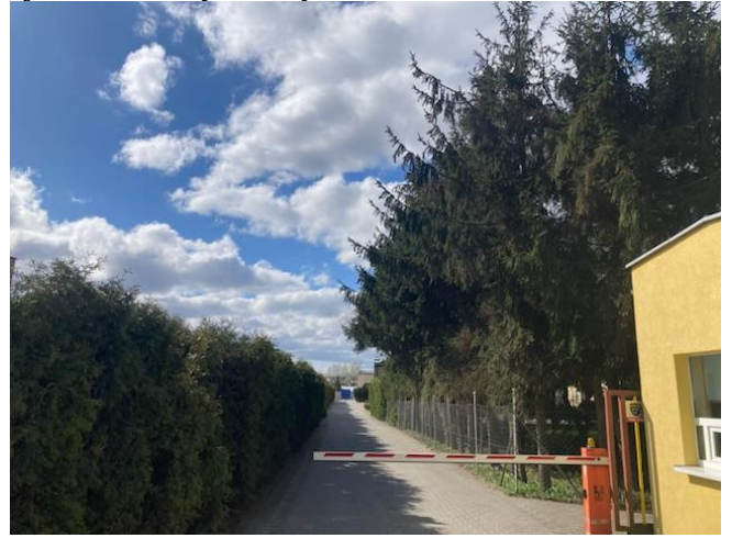
Droga wewnętrzna firmy Natalii Sp. z o.o.