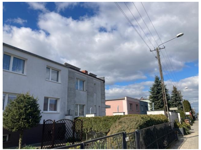
Zabudowa mieszkalna jednorodzinna przy ul. Gołęcińskiej