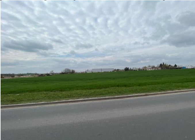
Tereny niezagospodarowane na obszarze planu