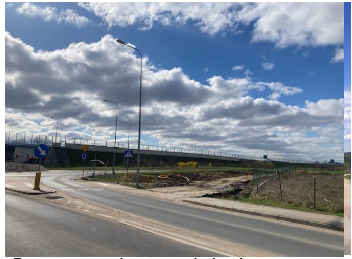
Droga ekspresowa S4, lokalizowana w bezpośrednim sąsiedztwie planu